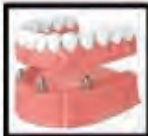
Implant- Supported Denture

TRỒNG RĂNG GIÁ ĐỦ LOẠI (Dental Implants)