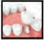
Single Tooth Dental Implant

Fellow International Congress Oral Implantologists